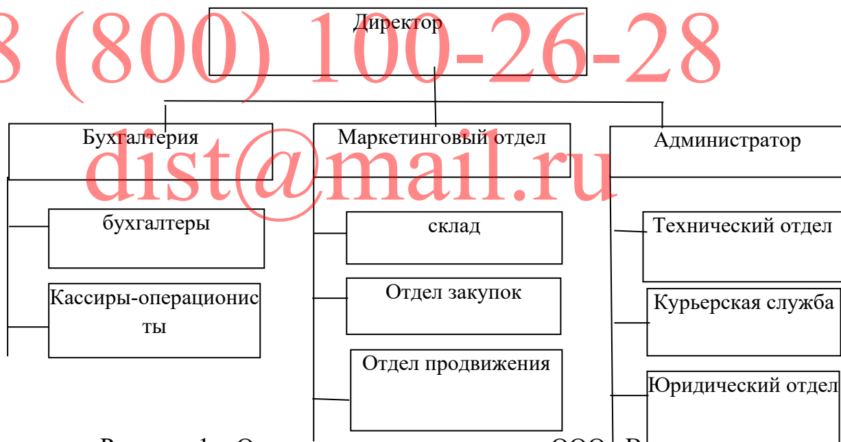
Рисунок 1 – Организационная структура ООО «Виктория»

Возглавляет ООО «Виктория» директор предприятия (рисунок 1).