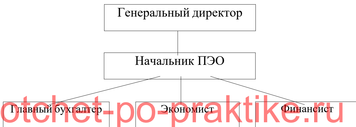
Рисунок 3 - Структура планово-экономического отдела ООО «ПК ВентКомплекс»

Структура планово-экономического отдела ООО «ПК ВентКомплекс» представлена на рисунке 3.