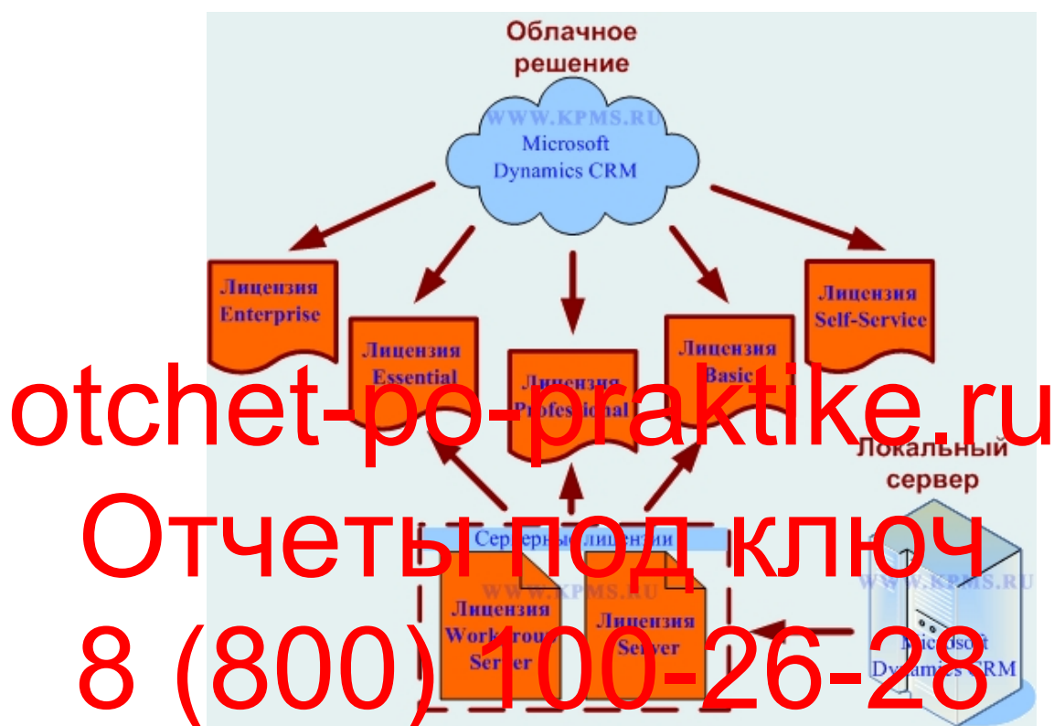
Рисунок 2 – Облачное решение MS Dynamics CRM

- Microsoft Dynamics CRM 2016 Server. Для этой лицензии нет ограничений на количество пользователей системы. Сервер может обслуживать несколько предприятий, входящих в холдинг. Возможна установка нескольких экземпляров сервера и установка сервисов на основе ролей.